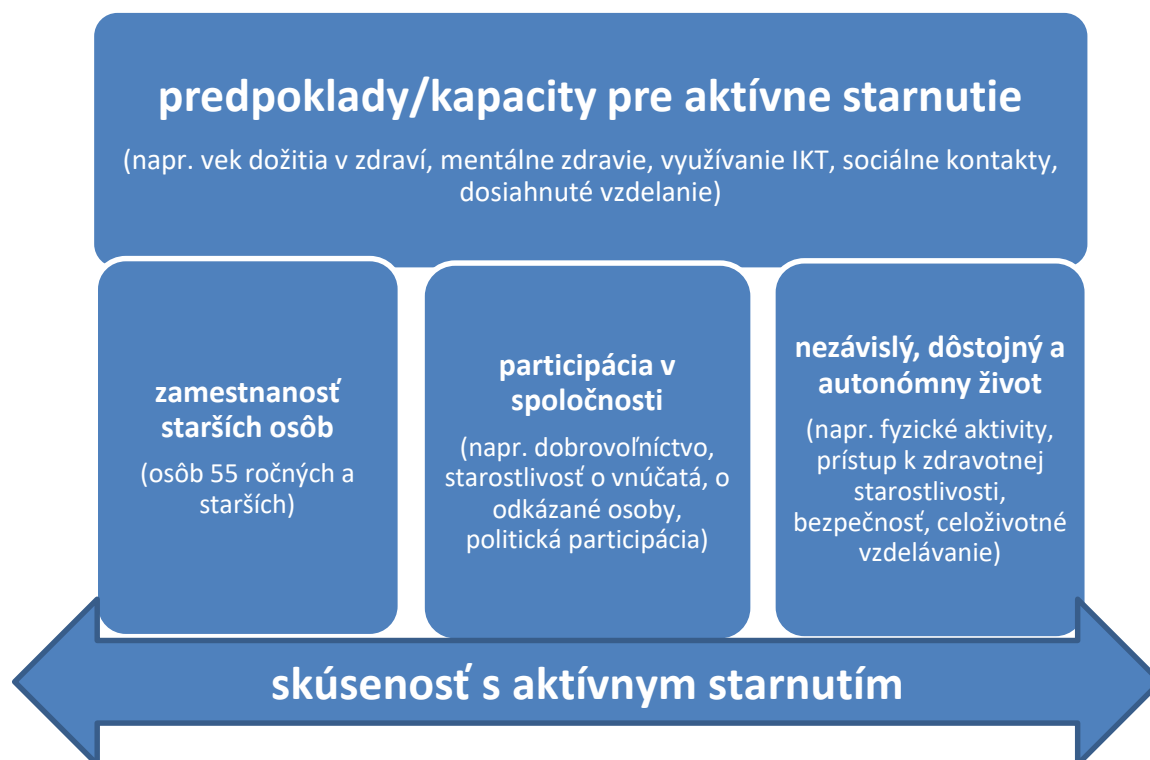
Schéma2: Štruktúra indexu aktívneho starnutia a jeho domén